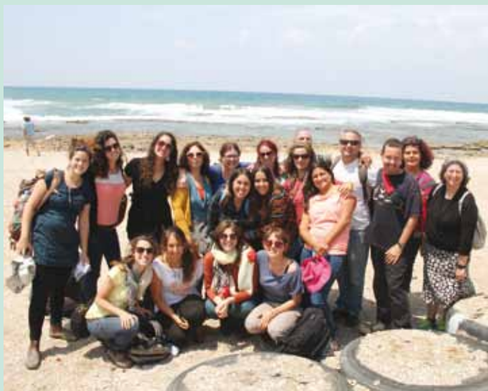
ביקור בג'אסר אזרקה בקורס תצורת פדגוגיות עם רביב