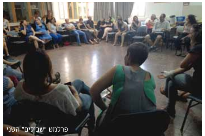
פרלמט "שבילים" השני

אני חושבת שיש חשיבות רבה בהעברת סדנא שכזו בשבילים היות ומדובר בסטודנטים (לחלקם זו הפעם הראשונה שהם עומדים בפני סיטואציה כזו) שהבחינות מהוות עבורם מצב לחץ שאינו מאפשר להם לעבור את תקופת המבחנים בצורה מיטבית. מעבר לכך, הערך המוסף הינו שסדנא כזו יכולה לעזור לכם כאנשי חינוך לאתר תלמידים הלוקים בחרדת בחינות ולהציע להם פתרונות להתמודדות.