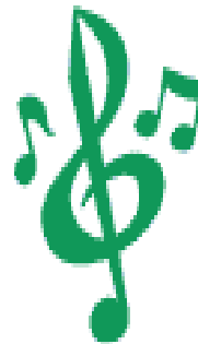
Music Smart (Musical)