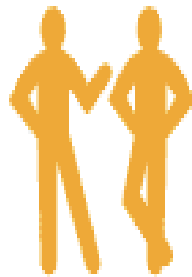
People Smart (Interpersonal)