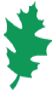
Nature Smart (Naturalist)