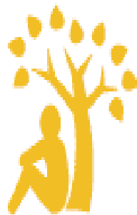
Self Smart (Intrapersonal)