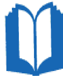
Word Smart (Linguistic)