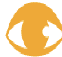
Picture Smart (Spatial/Visual)