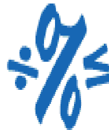
Number Smart (Logical/Mathematical)