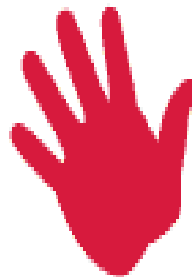
Body Smart (Bodily-Kinesthetic)