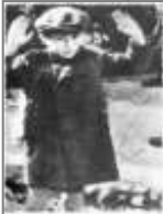
איור: נעמה לוי

אמא עוד הזכירה לי את הכיפה על הראש וככה הייתי עם כובע כל הזמן. יום אחד הרשעים האלה תפסו אותי וצעקו לי להרים ידיים – ואני הרמתי, אבל בלב עשיתי את זה בגאווה שאני יהודי! וברוך ה' לא עשו לי כלום, ואחרי כמה שבועות הגיע צבא אחר ששחרר אותנו, וזכיתי לעלות לארץ ישראל.